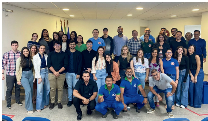
Imagem: Festa do dia do servidor em Garanhuns | Out de 2025

O SINDSEMP-PE promoveu, no dia 24/10/25, a Festa do Dia do Servidor Público, reunindo servidores e servidoras em um momento de confraternização, reconhecimento e valorização da categoria.