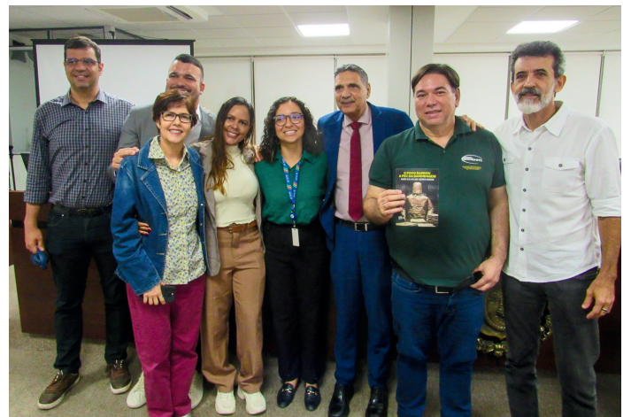
Imagem: Audiência Pública na ALEPE | Dez 2025

As atividades reforçam o compromisso do nosso sindicato com a defesa do serviço público, dos direitos dos servidores ativos e aposentados e do fortalecimento das políticas públicas. A luta contra a Reforma Administrativa segue como prioridade da atuação sindical, com mobilização permanente e diálogo com a categoria e a sociedade.