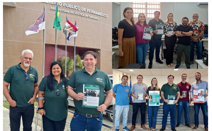
Imagem: Promotoria de Caruaru | Out 2025

Imagem: Promotoria de Garanhuns | Nov 2025