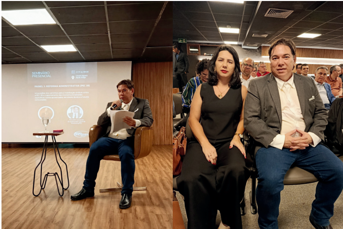
Imagem: Seminário sobre a Reforma Administrativa na livraria Jaqueira | Nov 2025

O SINDSEMP-PE esteve no ano de 2025 atuando de forma firme e articulada na luta contra a Reforma Administrativa (PEC 38/2025), que representa graves ameaças aos direitos dos servidores públicos, à estabilidade das carreiras e à qualidade dos serviços prestados à população.