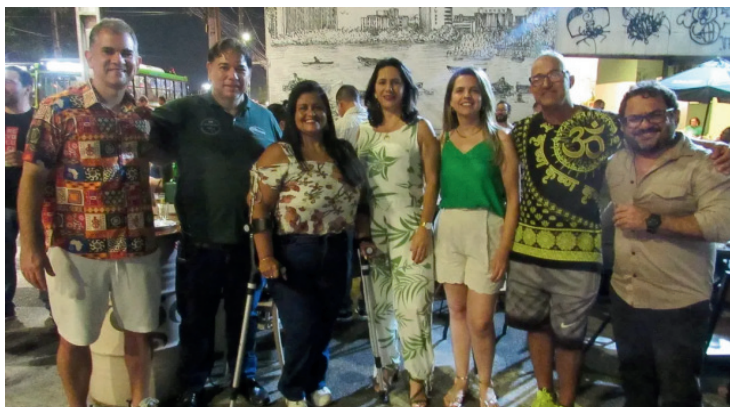
Imagem: Diretores do SINDSEMPPE na festa do dia do servidor em Recife | Out de 2025