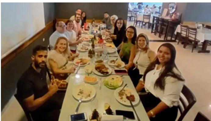
Imagem: Confraternização descentralizada em Carpina | Dez 2025

As confraternizações de fim de ano reafirmam a importância da valorização dos servidores e servidoras e do fortalecimento da organização sindical.