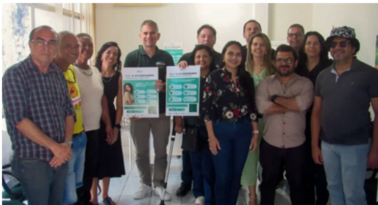
Imagem: Diretores do SINDSEMPPE e Representantes de Base | Out 2025

O SINDSEMP-PE realizou reunião ordinária do Conselho Deliberativo, com a participação de integrantes da coordenação e de conselheiras e conselheiros que representam a base em todo o Estado.